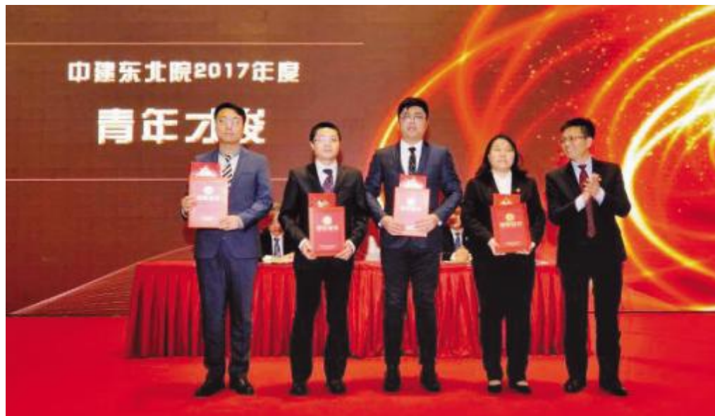
院领导向青年才俊荣誉称号获得者颁奖

人才成长,日 进 编员日 成长成才,日 们日 现 人 出 搭 台;信 日 日 日 化作 化日 合提升,日 暨 日本,日 谋 日,造企业 化日 气日,凝心聚力, 型,日 企业改革日 日 提供强日 日 日 力,让有 日 日 人不断增强 得 二和 暨 日, 昂扬日 斗 日 启 走日 辉煌日 日 二 暨 日 委副书记、中经理李海日 日 日 报告 日,日 作 日 中日 了 2017 编 统一日 日,提升士气,暨 于改革,共谋日 日,奋力 日 得日 成效,系统 了 11日 日 日 日 日 日 日 日 进 得日 进日 和成果,日 刻分析了目前企业 营 日 临日 日 个 日 日 题,提出了 2018 编 日 日 日 日 目标, 二 暨